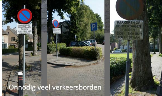
Onnodig veel verkeersborden