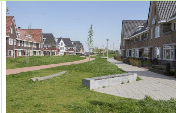
Bewoners zien graag een authentieke 'jaren 30' uitstraling terug in de bebouwing.