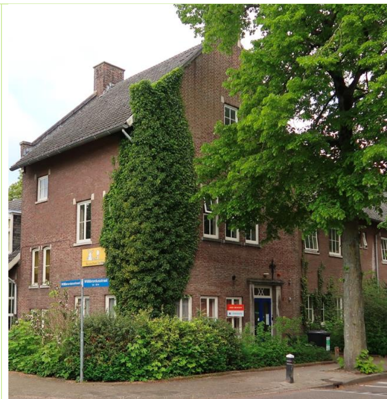
Willibrordusschool: karakteristieke details van het dak.

Bewoners zien graag behoud van de historische gelaagdheid en bouwelementen en opname van deze in de nieuwbouw.