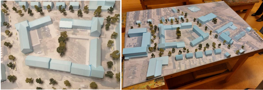
Figuur 6: Maquette is gemaakt met een schaal 1 op 200