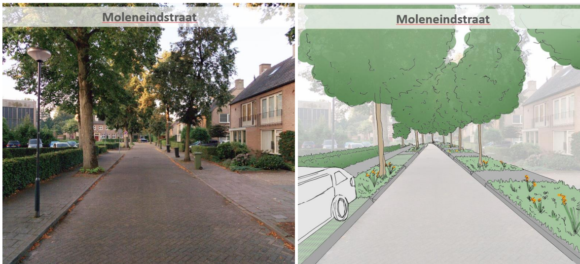
Figuur 1: Bestaande situatie (links) en Profielschets (rechts) Moleneindstraat Het trottoir rechts komt te vervallen en wordt een groenstrook. Trottoir links wordt een groenstrook met parkeerplaatsen en het voetpad erachter langs. Het trottoir komt zo aansluitend in de 'binnenring' te liggen waardoor oversteken niet nodig is. Er kan wel steeds in een lijn de doorsteek naar de woningen gemaakt worden. Dit model biedt de ruimte aan bomen, en daardoor minder ruimte voor trottoirs en parkeren. Bewoners vragen zich af of Lindes op 5 meter van de gevels een probleem gaan vormen. Er is ook een stuk van het perceel