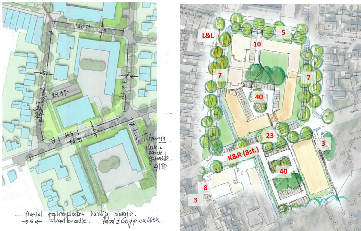
Figuur 5: Kaartje van bewoner Henk met 60 parkeerplaatsen (links) en kaartje van André met 146 parkeerplaatsen (rechts)

De verkeerskundige heeft een model toegepast, dit is een technisch verhaal wat erg de diepte ingaat en afhankelijk is van waar en wanneer welke ontwikkeling plaatsvindt. We weten op grote lijnen wat de functies worden en in welke volgorde ontwikkeld wordt. Bewoners vragen zich af er voldoende parkeerplaatsen gerealiseerd kunnen worden, daarbij rekening te houden met de bestaande functies.