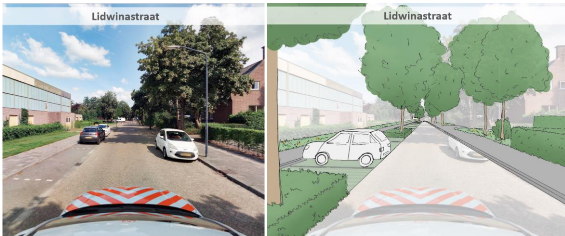
Figuur 4: Profielschets Lidwinastraat

In de schets is nu haaks parkeren ingetekend om meer plekken te creëren wel met groene vakken ertussen. Zo wordt het beeld van een groot parkeervlak voorkomen. Er moet hier rekening gehouden worden met veel fietsers en auto's tijdens de breng en haal momenten voor de school wat nu gevaarlijke verkeerssituaties oplevert.