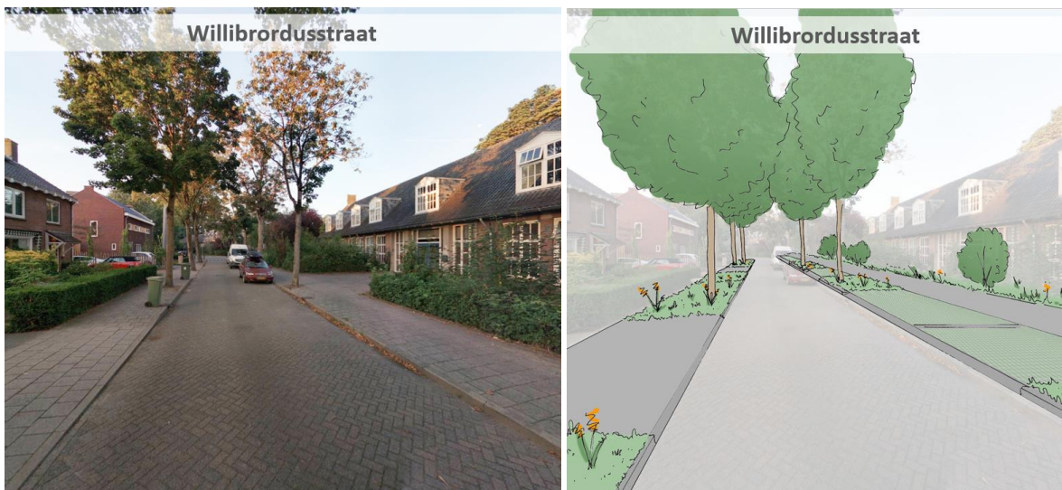
Figuur 3: Profielschets Willibrordusstraat

Eén trottoir aan de rechterzijde, meer ruimte voor bomen en groenstroken en parkeren tussen de bomen. Plek voor het laden/lossen van de Kruidvat moet ook een plek krijgen zodat die niet in het wegprofiel staat, dit kost één lindeboom. Bewoners geven mee dat de oversteek van het voetpad naar het Moleneindplein van belang is. In de bocht komt heel veel samen. Het is nu een onveilige bocht waar auto's niet goed zicht hebben op aankomend verkeer. Het laden en lossen vragen bewoners zich af of dit ook opgelost kan worden door afspraken met de ondernemers te maken.